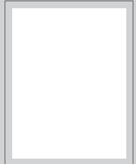
Passfoto des Kartenbenutzers (bitte hier einkleben)

Postleitzahl [ ] [ ] [ ] [ ] [ ] [ ] Wohnort _____ Geburtsdatum [ ] [ ] [ ] [ ] [ ] [ ] [ ] [ ]